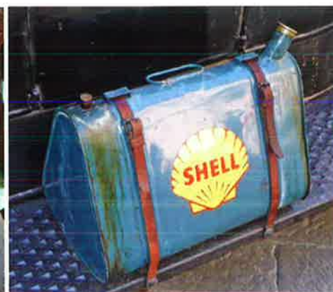
Premium-benzine is al een goed alternatief.